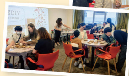
美味甜點及歡樂手作