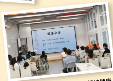
疏肝解鬱——從中醫角度培育精神健康

透過不同主題的工作坊，讓家長及子女放鬆身心、消除壓力的同時，也讓同學們在快樂的氛圍中學會珍惜與家人的相處時光。