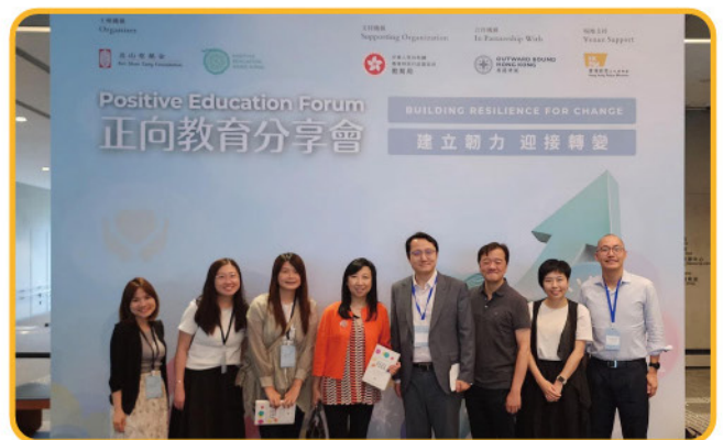
本校獲邀於教育局的「整體課程規劃學校經驗分享會」中作為主講嘉賓之一，分享如何透過全校參與的方式，帶領學校團隊致力營造正向氛圍，並藉著兩個創新的校本課程：「中一創意價值教育課」及「中四未來領袖課程」，裝備同學迎向未來。

本校受邀出席香港貴州文化交流基金舉辦的「黔港締結姊妹學校2024分享會」，並分享兩地姊妹學校交流心得，共結黔港情誼。