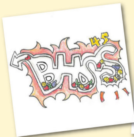
45周年校慶標誌原稿

我所設計的標誌中間有學校英文名簡寫，外圍運用了水管作設計。水管裏有一些元素，包括火箭、愛心、笑臉和十字架，分別代表著科技、愛心、正向和基督教信仰的含義，這些多元的信息藉水管傳遞至學校每個角落，帶出「正向薪火燃 創科邁向前」的意念，呼應45周年校慶主題。