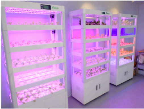
室內種植室的層架，光譜可供調校，以觀察同類種物的生長差異。