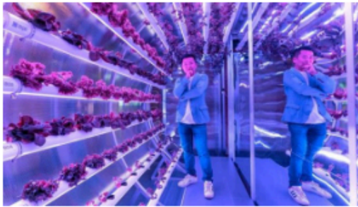
講詞篆表示光譜的調校，可供同學有更多種植的研究方向。