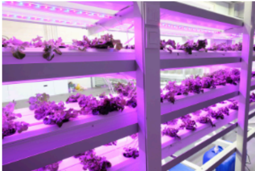
另還有一間無菌室，可嘗試種植植物。