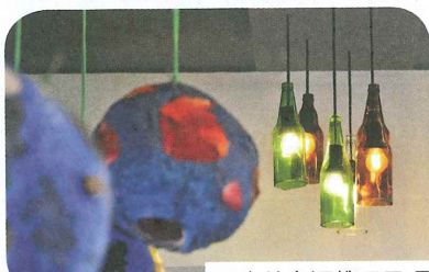
正向教育還推己及環境，同學學習循環再用愛惜地球。

何明華會督中學同樣推行正向教育多年，並跟李金小學一樣有參加「賽馬會正得正教育計劃」。校長金偉明表示：「學校的正向教育有別於一般正向教育課程，是由困難出發培育學生面對挑戰，提升抗逆力。」他解釋：「未來世界是急速改變的世界，學生只學習知識不足以面對未來世界的挑戰，需要有很強的自信心、抗逆能力，發揮性格優勢，建立不易放棄的態度，方可面對將來的變化。」而學校的正向教育課程建基於GPS概念。「即堅毅 (Grit)、熱情 (Passion) 和方法 (Strategy)。」