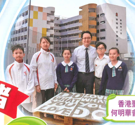
香港聖公會 何明華會督中學