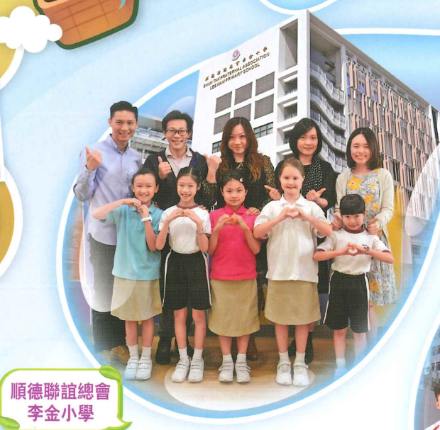
順德聯誼總會 李金小學