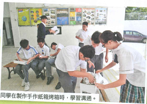
同學在製作手作紙箱烤箱時，學習溝通。

面對中一學生剛升上中學的適應問題，學校特別安排「創意價值教育課堂」。課堂以正向教育PERMA的理念作基礎，以不同媒介發掘學生的創意、潛能及興趣，並培養正面的價值觀。楊庭威老師指出，為讓學生由認