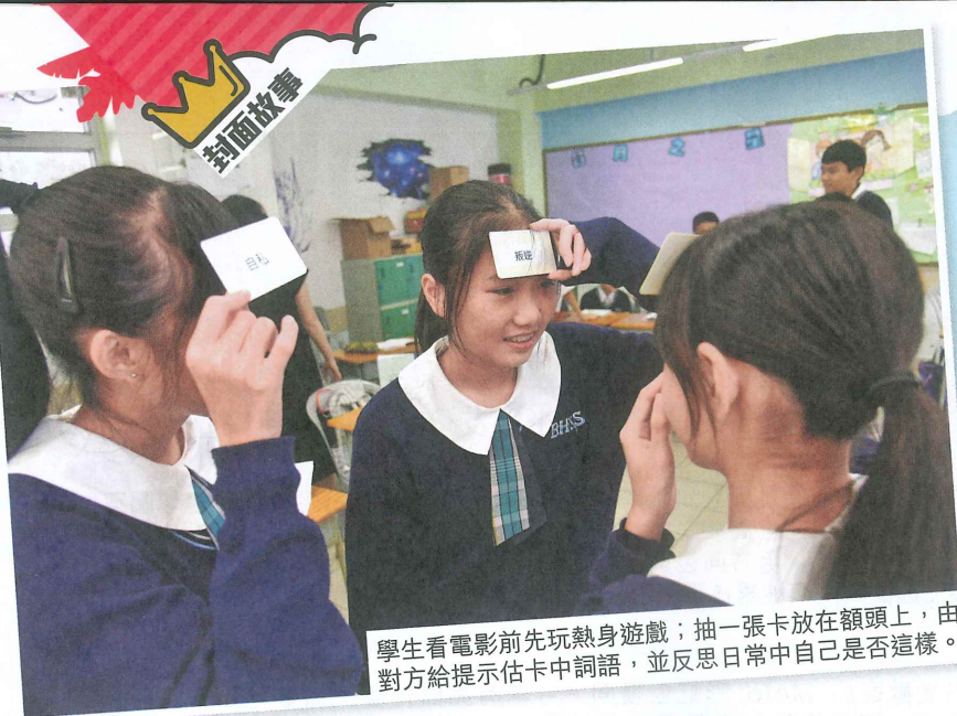
學生看電影前先玩熱身遊戲；抽一張卡放在額頭上，由對方給提示估卡中詞語，並反思日常中自己是否這樣。

識自己到校園，學生會佈置自己的課室、設計自己的書枱。「可以在上面畫圖畫，或互相寫些鼓勵字句，從而學懂欣賞別人，明白自己的強項。」