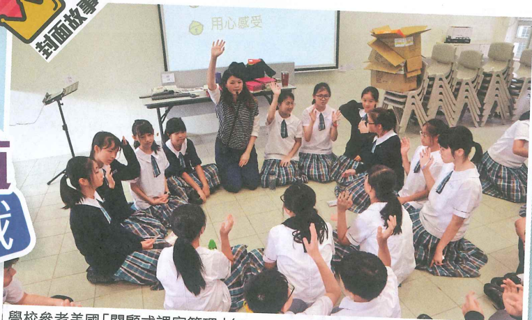
學校參考美國「關顧式課室管理」(Responsive Classroom Management) 的教學法，並融入到課堂上。

師一起入營接學生，他們都哭了，但是開心的，很有成就感，足見是辛苦，但成果豐盛。」除了個人成長，學校更把學生的正向思維推至社區。「學校會舉辦大型活動，如中秋晚會，邀請街坊來到學校，學生負責各攤位遊戲，訓練他們的組織、領導、溝通和創意能力。」