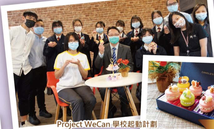
Project WeCan 學校起動計劃 趁墟做老闆 2021新Teen地