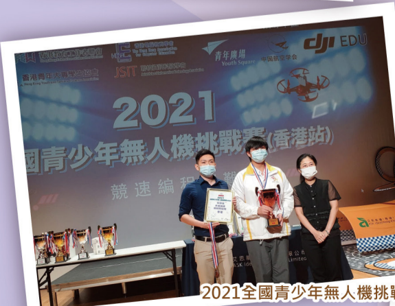
2021全國青少年無人機挑戰賽(香港站)