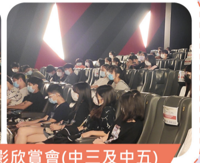
《媽媽的神奇小子》電影欣賞會(中三及中五)