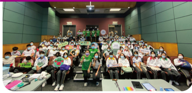
「思·創·好世界」跨科專題考察(中二)【嶺南大學樂齡科技館】