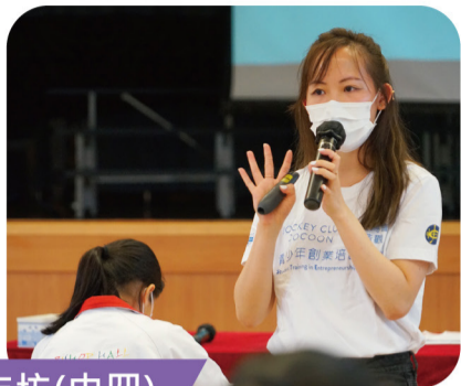
賽馬會浩觀青少年創業培訓工作坊(中四)