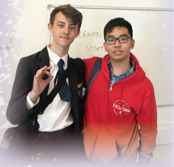
感謝，我的學習夥伴 (左)

對於平日較少出遠門的同學而言，最難忘的是 14 天的英國之旅，均居於寄宿家庭，適應及細味當地的生活和文文化，增加與當地人以英語溝通的機會。部份同學更需協助寄宿家庭清潔家居，全面融入英國式的家庭生活。