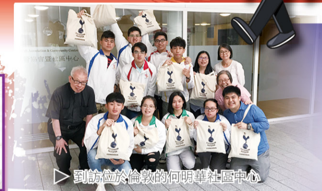
到訪位於倫敦的何明華社區中心