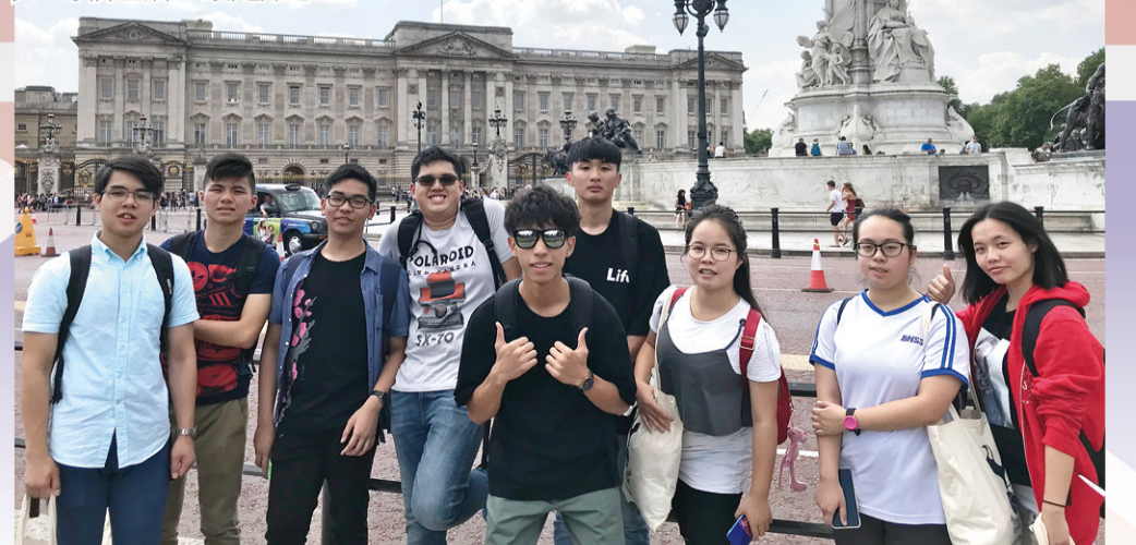
藉國際交流，了解異地文化