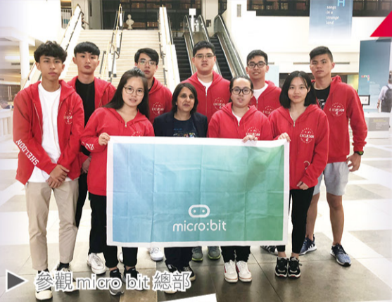
參觀 micro:bit 總部

今年 5 月，本校成為全港首間 Micro:bit Champion School，遂特別安排同學與 Micro:bit Education Foundation 執行總裁 Kavita Kapoor 會面，啟發同學對編程的興趣。同學們更在火箭車基地，進行了實地探索和火箭車設計比賽，親身體會火箭車的魅力。