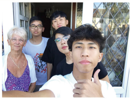
寄宿生活，最是難忘